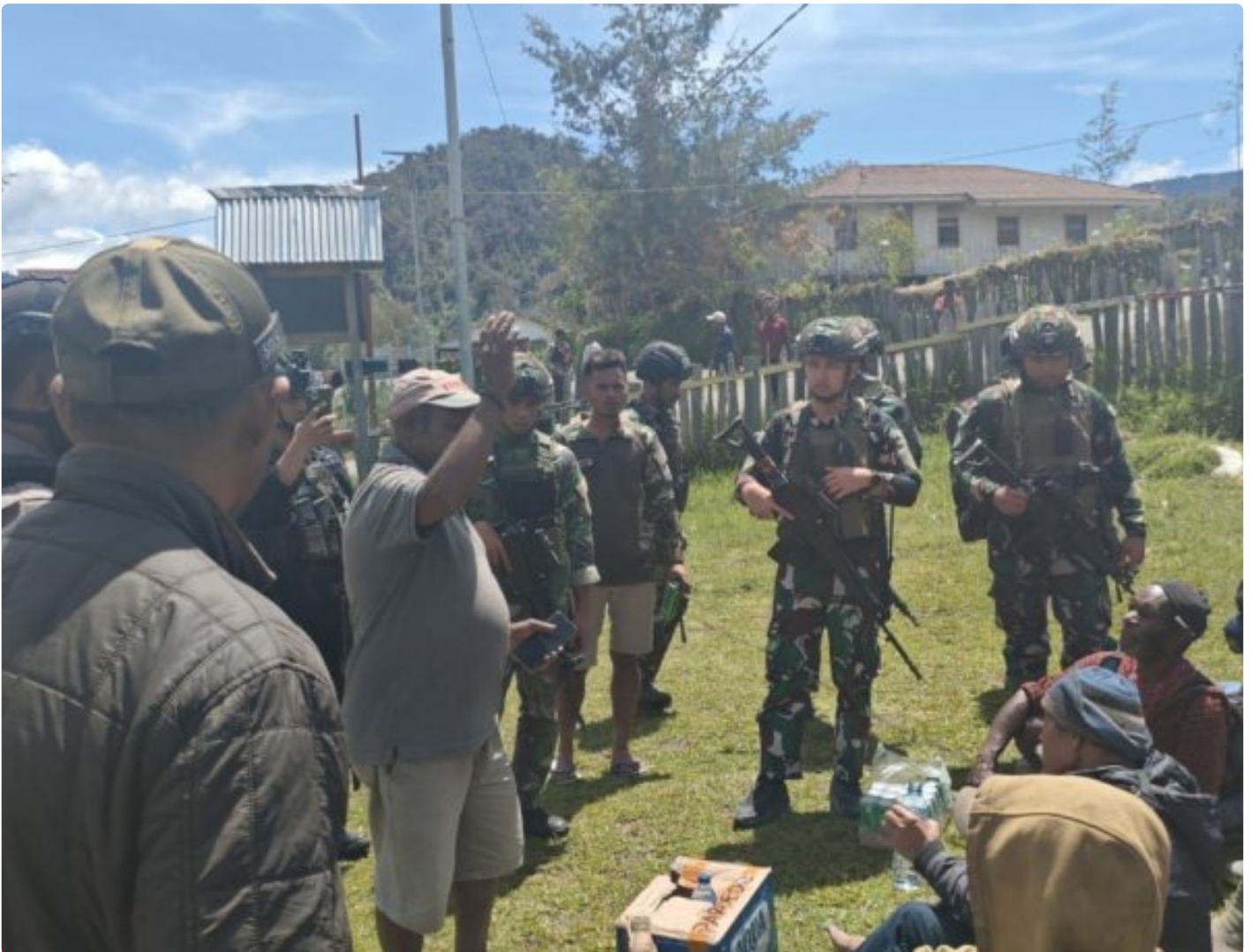
TK Sinak bersama Apkam TNI-Polri Berhasil mengamankan pekerja Pembangunan Puskesmas Sinak Barat

Satuan Tugas (Satgas) Yonif 323/Buaya Putih Kostrad berhasil mengamankan 14 Orang pekerja pembangunan Puskesmas Distrik Sinak Barat, di Kabupaten Puncak, Papua Tengah, dari ancaman kelompok bersenjata yang diduga merupakan Organisasi Papua Merdeka (OPM). Hal ini dilakukan setelah menerima laporan adanya ancaman serius terhadap keselamatan para pekerja