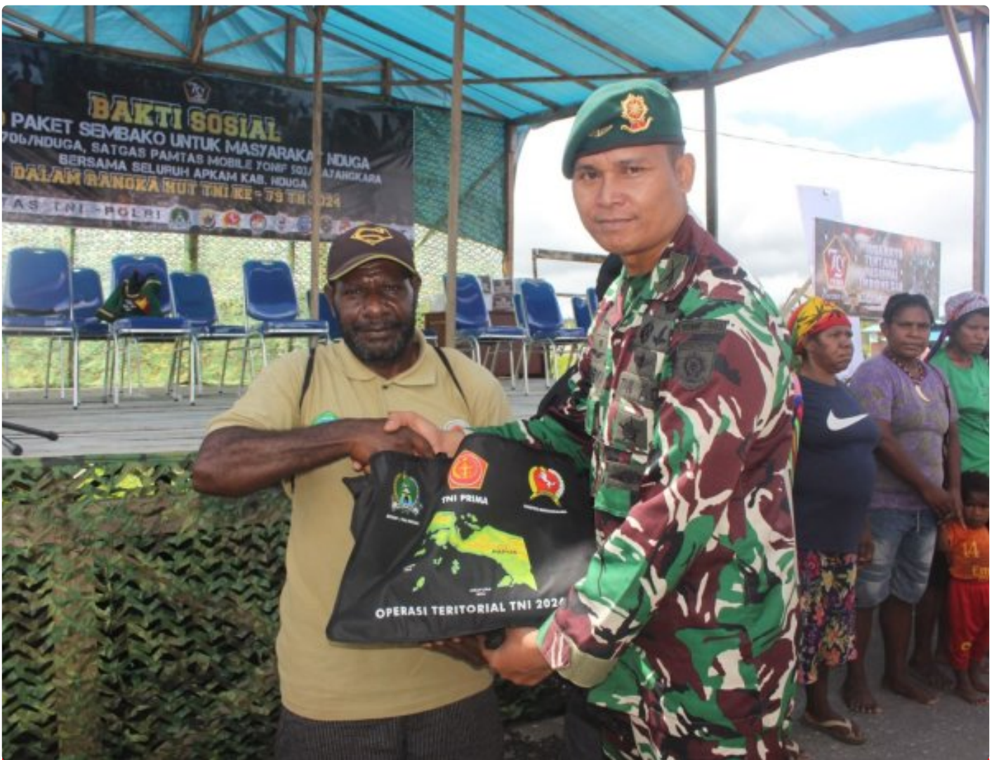
Foto: Satgas Pamtas Mobile RI-PNG Yonif 503/Mayangkara Koops Habema bersama seluruh aparat keamanan (Apkam) Kabupaten Nduga Bagikan 1000 Paket Sembako Dalam rangka HUT TNI Ke - 79, yang Dilaksanakan Secara Bertahap di Kota Kenyam Kabupaten Nduga Papua. Jumat (04/10/2024).